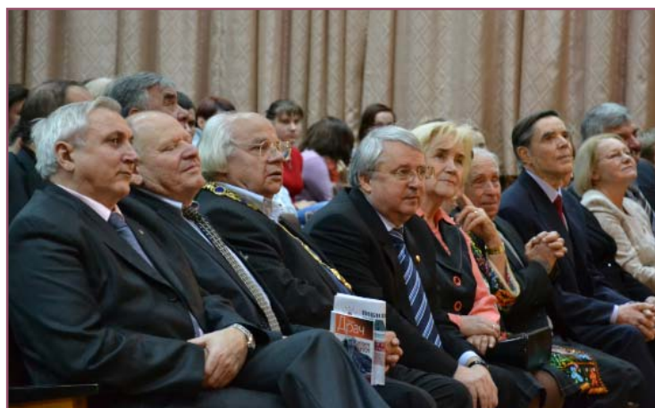
Ювіляр і керівництво вищу уважно дивляться студентські виступи

житейські їх захоплюють. Але хочеться вірити, що молоде покоління педагогів розкриє перед учнями справжню красу української літератури, і в ній чільне місце займе постать І. Ф. Драча. І ми пишаємося тим, що і в далекій Македонії поезію нашого ювіляра люблять і знають.