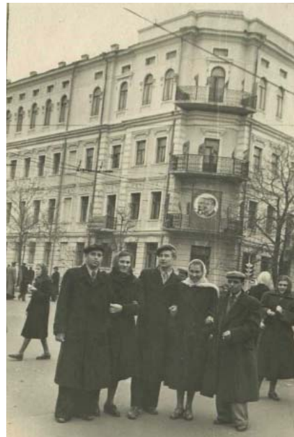
З однокурсниками біля стін педагогічного інституту імені О. М. Горького, 1953 р.

Колектив НПУ імені М. П. Драгоманова, кафедра теоретичної та консультативної психології Інституту соціології, психології та управління