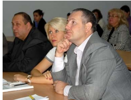
Драгомановці готують до нового кроку в роботі