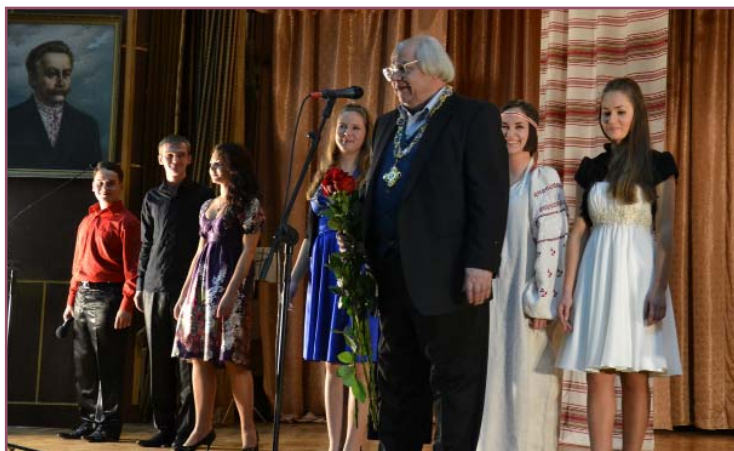
Ювіляр вражений любов'ю молоді до поезії

Крім того, справжній поет не потребує слави, бо він