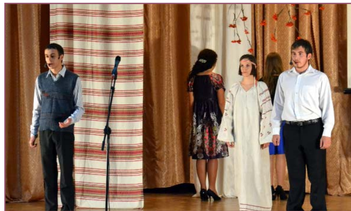
Вистава театру “Вавилон”

Олесь Довгий акцентував увагу слухачів на тому, що для кожного учасника святкового дійства ця година – унікальна, бо спілкуємося з живим класиком української літератури. Є поети, з творів яких не зможеш вибрати і цитати, а от рядки поезії І. Драча хочеться вивчати, повторювати, використовувати у розмові, бо краще не скажеш. Можливо, сьогодні, коли йдуть такі складні процеси в суспільстві, не всі тягнуться до поезії. Можновладці не люблять поетів за гостре, дошкульне слово, а людям простим не завжди по кишені томик віршів, та і проблеми часто