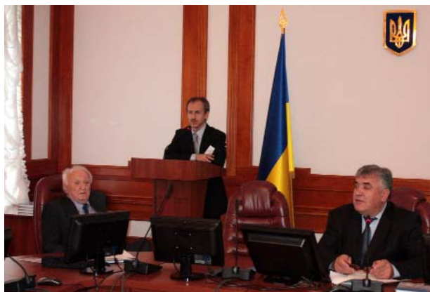
ПГК - унікальний міжнародний захід

Протягом трьох днів учасники могли почути виступи вчених світового рівня, що стосувалися актуальних проблем культурознавства й культурфілософії, феномену ісихазму, гострих питань гармонізації міжрелігійних стосунків в Україні. Глибокі дискусії в наукових колах викликали міжнародний семінар “Пізнаючи надприродне: шляхи філософії релігії”. На ньому чи не найповніше було представлено позиції сучасних філософів з Росії, Америки, Польщі, Фінляндії. Врешті діалог вийшов досить конструктивним, а учасники дійшли спільного консенсусу.