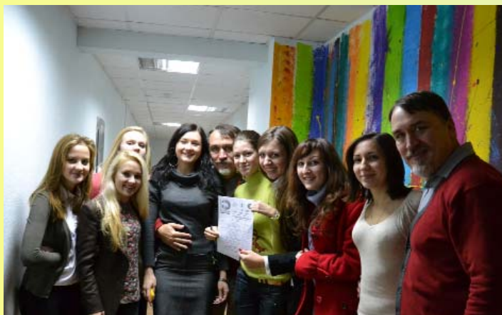
Брати Капранови завжди бажані лектори в університеті

Антін Мухарський презентував культурологічний проект “Союз вільних художників”. “Ми намагаємось привести людину в “культурний шок”. Таким чином включається внутрішня психомоторика людини і досягається мета – людина входить у поле сучасного мистецтва”.