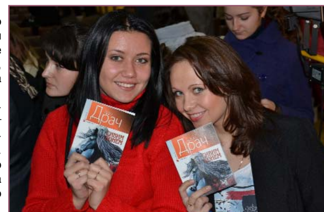
Студенти радіють збірці з авторським підписом

Людмила БИСТРОВА-ДРОБОТ