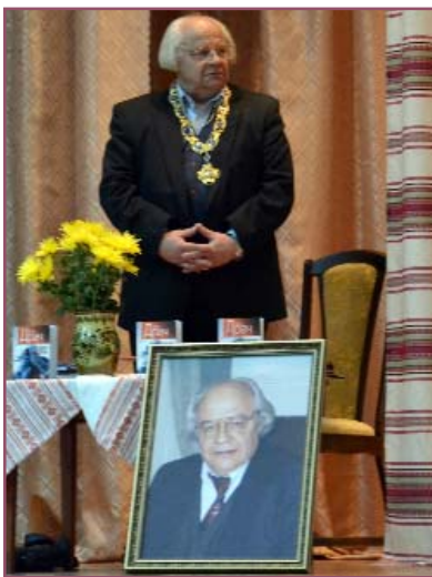
75-ліття ювіляра урочисто було відзначено в університеті

Його поезії не можна читати легко, бо в них біль Чорнобиля і відгомін військових лихоліть, стогін природи, яку ми бездумно нищимо, і вболівання за загублене покоління, і віра в нове прийдешнє незалежної України, за яку він борюється і бореться протягом усього свого життя.