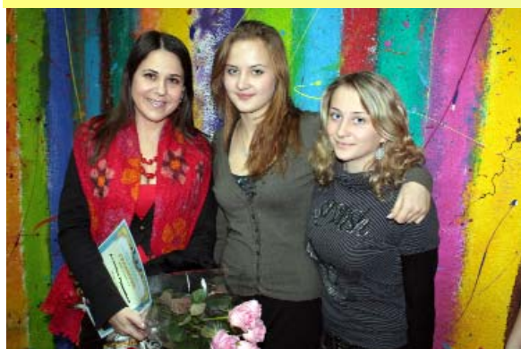
Анжеліка Рудницька розповіла про шоу-бізнес і свої шкільні роки