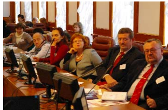
Форум не скидав обертів протягом усіх трьох днів

доктора філософії Кйонсанського національного університету (Корея), Віце-президента Міжнародної ради з “Філософії для дітей” Джинван Парка . Професор поділився враженнями про Україну: “У вашій державі це перший науковий захід, присвячений проблемам філософської освіти дітей, і вже досить великий крок у цій галузі. Моя методика ґрунтується на сократичному підході до навчання. Сподіваюся, вона стане корисною на сьогоднішньому Форумі. Я переконаний, що національна специфіка мислення українців та глибока педагогічна база, яку ви маєте у своїй науці, сприятиме виробленню оригінальної методики навчання дітей філософії, а цей семінар буде хорошою традицією обміну досвідом між країнами, тому особливо вдячний керівництву й організаторам”.