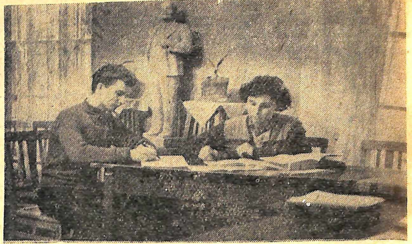
Студенти за роботою в червоному кутку гуртожитку № 2.